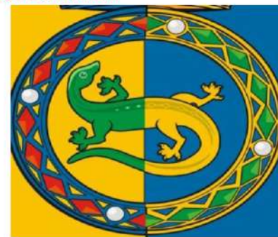
Управление образования администрации Горноуральского городского округа

Для создания и развития механизма реализации прав ребенка на защиту, декларированных в Конвенции и гарантированных Конституцией РФ, принят целый ряд законодательных актов – Семейный Кодекс РФ, Закон «Об основных гарантиях прав ребенка в РФ», Закон «Об образовании».